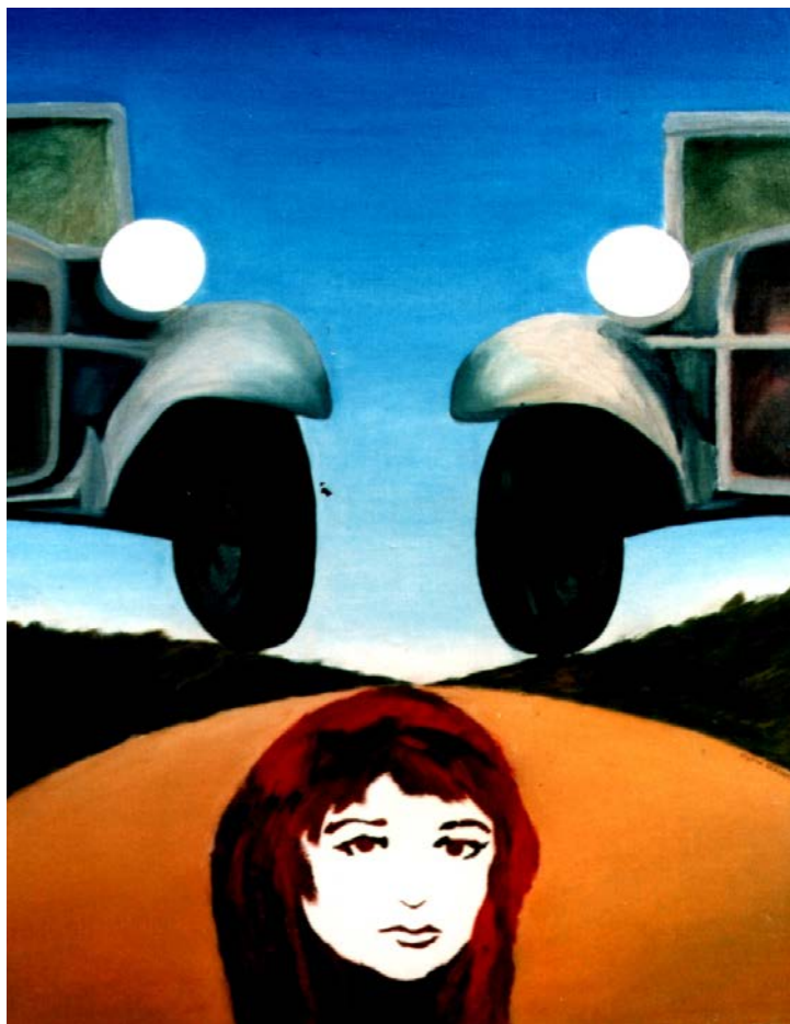
STEFAN BERDAK "Uważaj na drodze", akryl, płyta