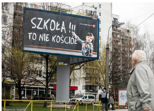
Lublin. Akcja bilbordowa organizacji Wolność od Religii (Jakub Orzechowski)