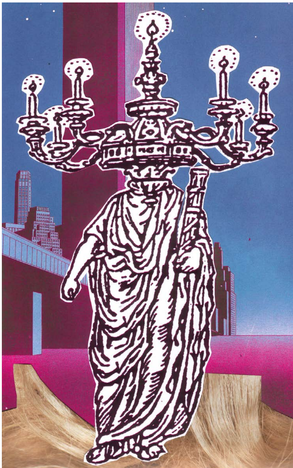
STEFAN BERDAK "Światło w mroku" akryl, płyta