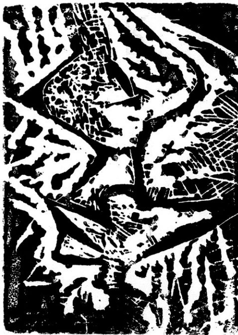
Roman Lasa – absoluwent ASP w Krakowie, uprawia rysunek, grafikę i malarstwo.