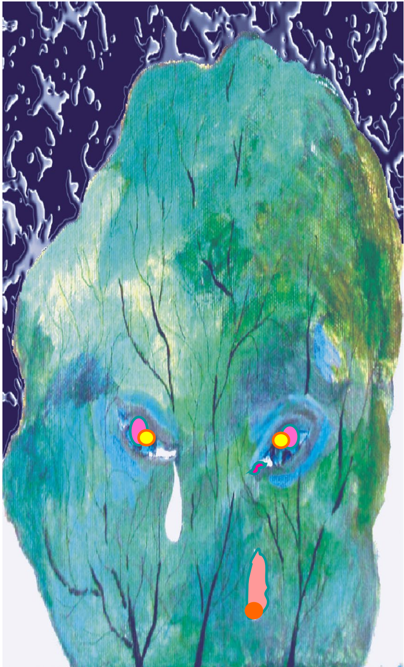
STEFAN BERDAK "Brrr, brrr... jak zimno", akryl, płótno,