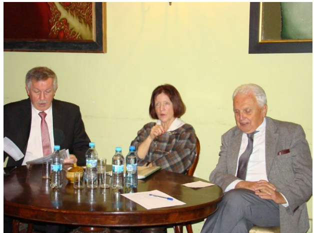
Wystąpienie prof. Jerzego J. Wiatra.