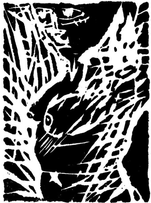
Roman Lasa – absolwent ASP w Krakowie, uprawia rysunek, grafikę i malarstwo.