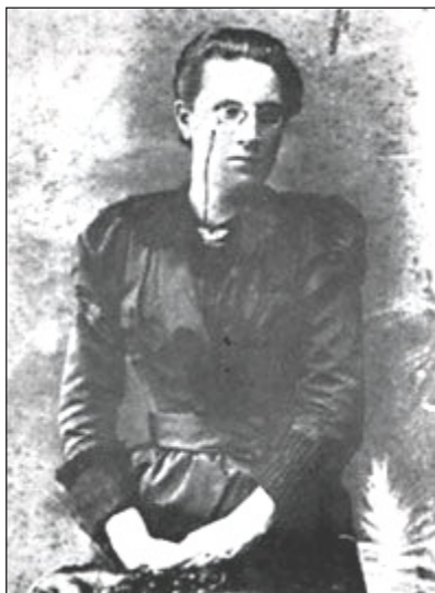
Paulina Kuczalska-Reinschmit