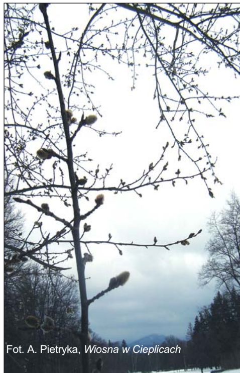
Wiosna w Cieplicach