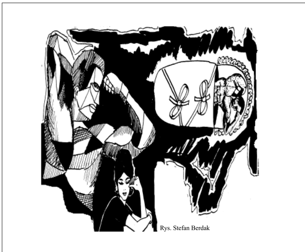
Rys. Stefan Berdak