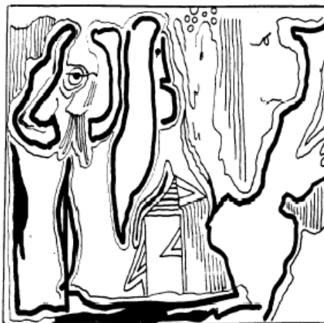
Rys. Stefan Berdak