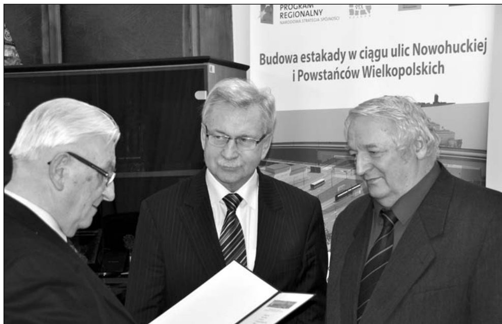
Na zdjęciu: Gratulacje od redakcji

Jestem pewny, że jego dotychczasowy dorobek pozwala ciepło i z sympatią patrzeć na takich ludzi. Bo przecież nie tylko słowa, ale przede wszystkim czyny stanowią o tym, za co możemy cenić każdego człowieka. W tym wypadku brak jest skali ocen, aby osiągnięcia zawodowe jak najlepiej, najlepiej ocenić. Należą się Panu brawa Panie Wiceprezydencie życzymy dalszych sukcesów na każdym odcinku działalności zawodowej, społeczno-politycznej jak i w życiu rodzinnym. □