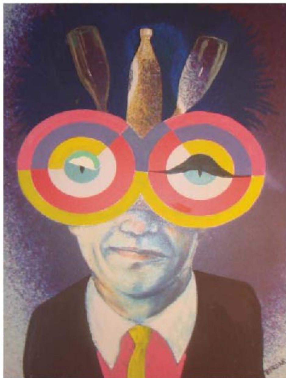
STEFAN BERDAK 2011 *