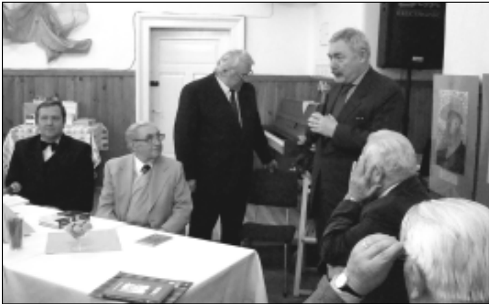
Przemawia prof. Jacek Majchrowski