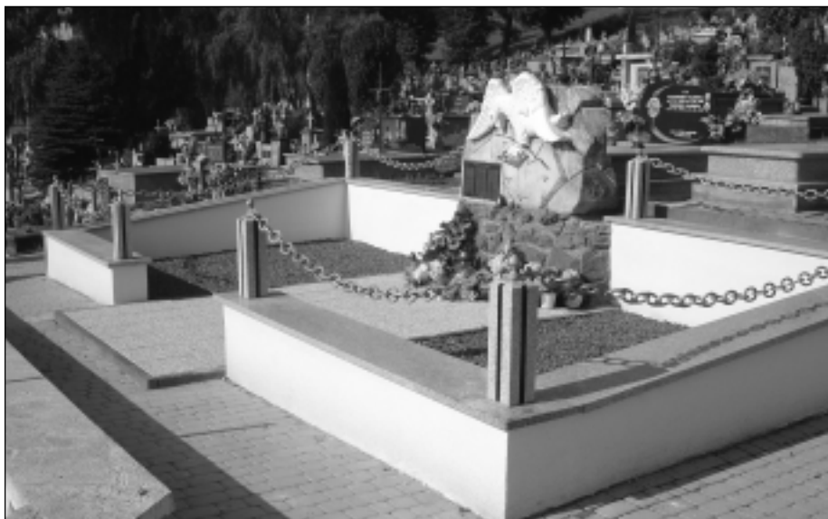
Widok mogiły po renowacji