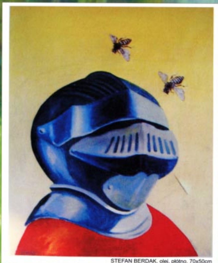
STEFAN BERDAK, olej, płótno, 70x50cm